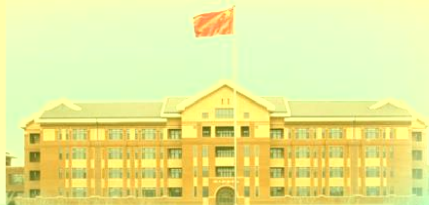
天津机电职业技术学院 TIANJIN VOCATIONAL COLLEGE OF MECHANICAL AND ELECTRICAL ENGINEERING